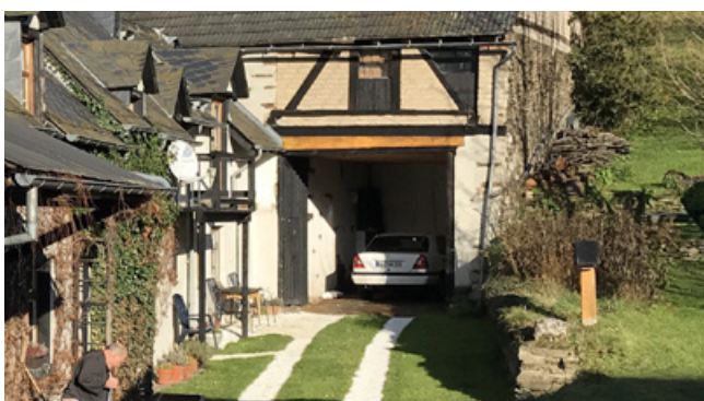
Positiv: Hauptgebäude und Carport bilden eine Einheit, wasserdurchlässige Zufahrt