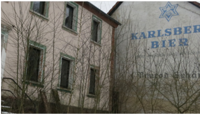
Negativ: großflächige Werbung