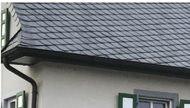
Negativ: überdimensionierter Dachüberstand (ortsuntypisch)