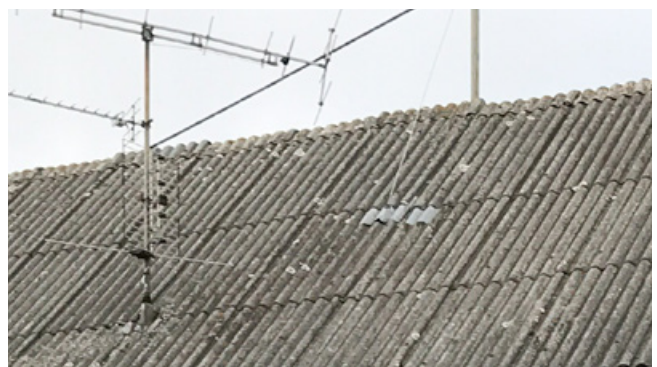
Negativ: Dacheindeckung aus Eternit