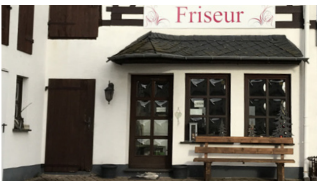
Positiv: Schaufensterelemente sind an die Fassade angepasst