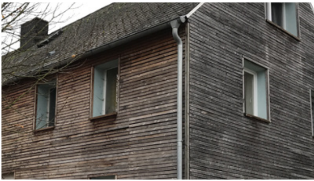
Holzverkleidung (nicht ortstypisch, aber möglich)