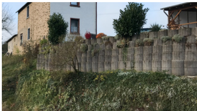
Negativ: Stützmauer aus Betonsteinen

(5) Jägerzäune und Maschendrahtzäune sind nicht regionaltypisch und daher zu vermeiden. Vorzuziehen sind natürliche