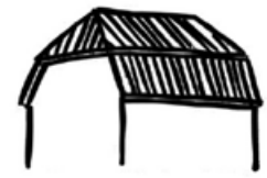
Mansarddach mit Schopf