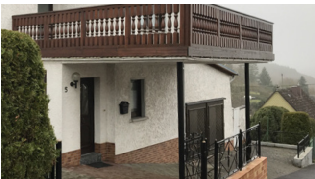
Negativ: im Vergleich zum Hauptgebäude überdimensionierter Balkon