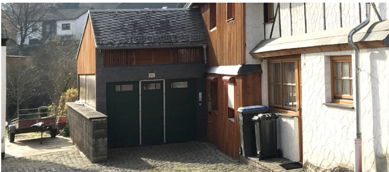
Positiv: Hauptgebäude und Carport bilden eine Einheit

(5) Der Bodenbelag eines Stellplatzes oder einer Garagenzufahrt ist so zu konzipieren, dass Wasser hindurchfließen kann. Hierzu zählen auch Zufahrten und Zuwege.