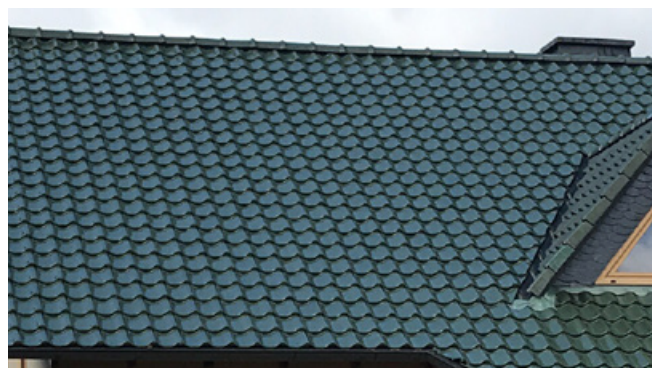
Negativ: Dacheindeckung mit glasierten grünen Ziegeln