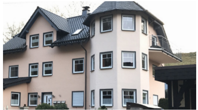
Gestalterische Disharmonie, Turm wirkt überdimensioniert