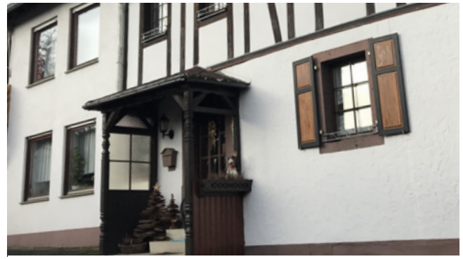
Positiv: das Vordach fügt sich harmonisch in den Bestand ein (Material/ Farbe)