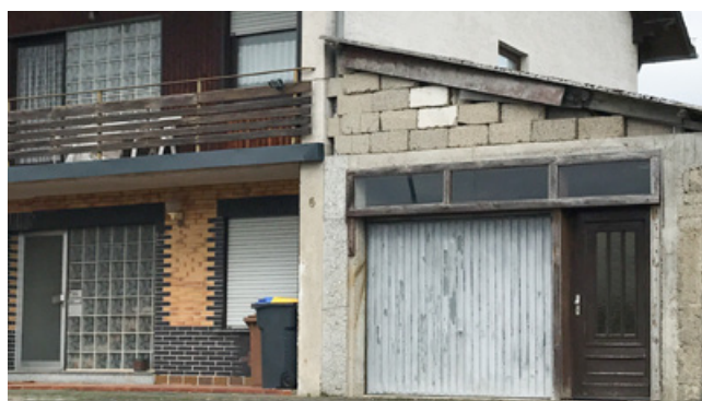
Negativ: angebauter Carport ohne Bezug zum Hauptgebäude