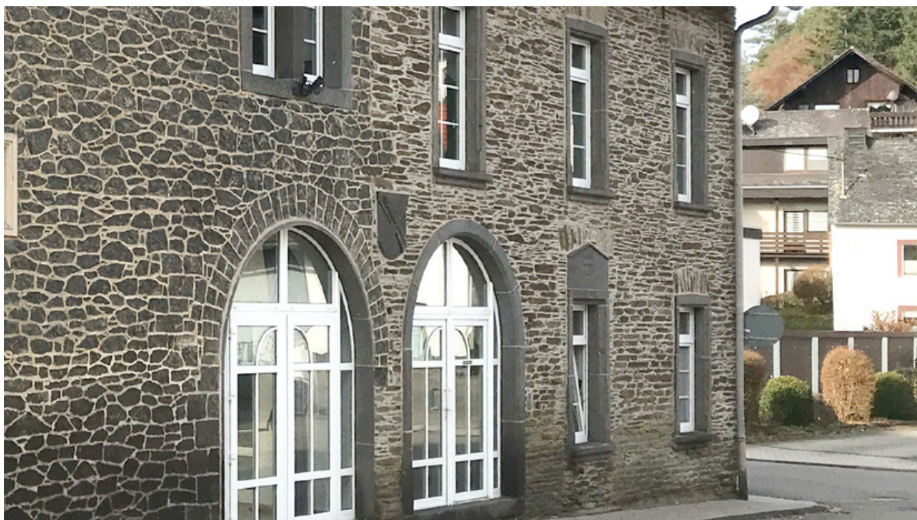
Positiv: auf Bestand abgestimmte Fensterelemente

(10) Sonstige Überstände (z.B. Windfang, Vordach) müssen in puncto Größe, Farbe und Form zum Gebäude passen. Sie sollten sich unauffällig in die Fassade einfügen und möglichst filigran und schlicht wirken.