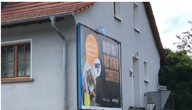
Negativ: Werbung außerhalb der Stätte der Leistung