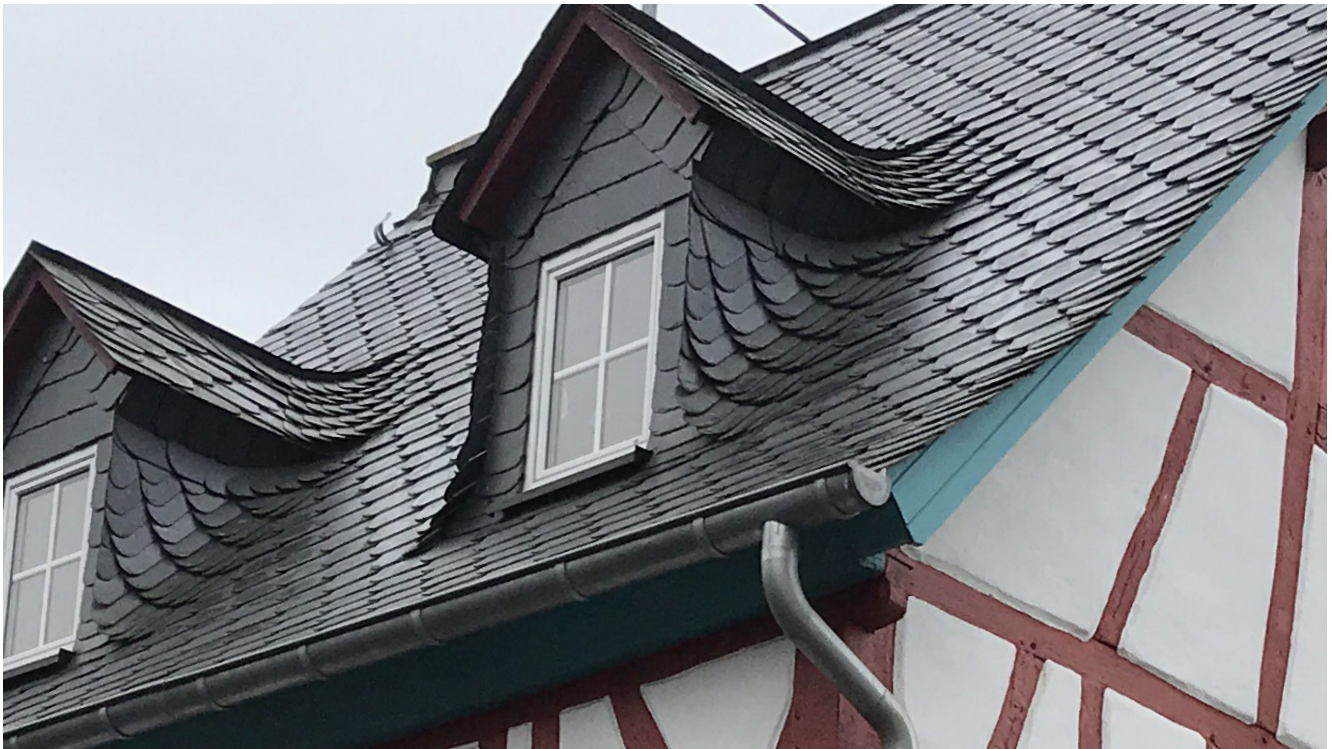
Positiv: Saniertes Fachwerkhaus mit Schiefereindeckung und Satteldachgauben (ortstypisch)