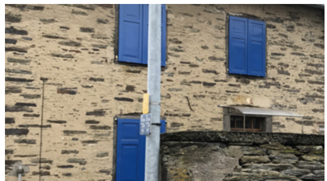
aufdringliche Farbgebung (Fensterrahmen, Klappläden)