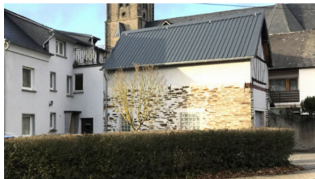
Positiv: Heckenpflanzung als Einfriedung