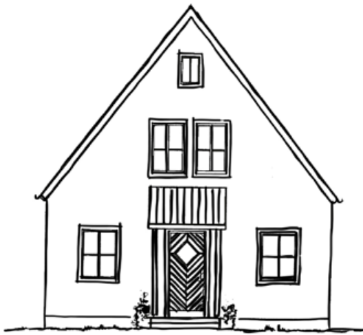
Beispiel für traditionelle Vordächer