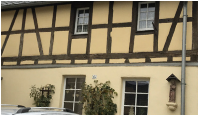
Positiv: renovierte Fachwerkfassade