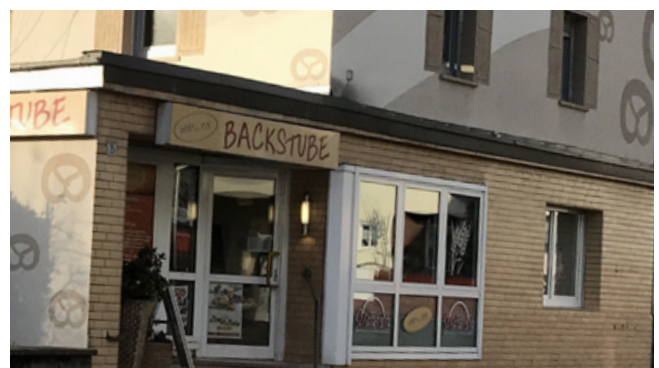
Negativ: Schaufenster berücksichtigt nicht die Gliederung der Fassade