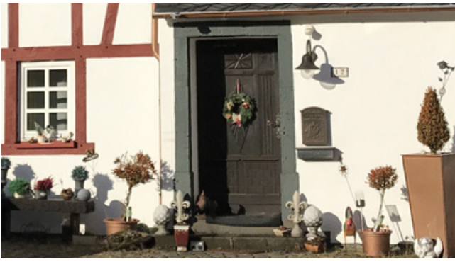
Positiv: die Tür fügt sich farblich harmonisch in die Fassade ein