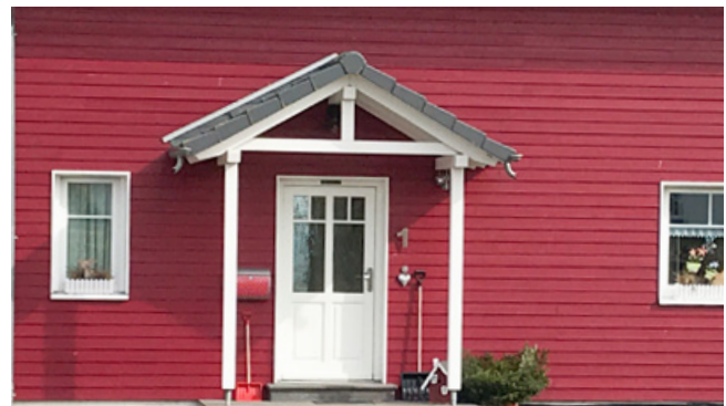
nicht bescheinigungsfähig: unangepasste Farbgebung (Typ „Schwedenhaus“)