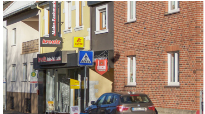
Negativ: Werbeanlagen reichen über das 1. OG hinaus