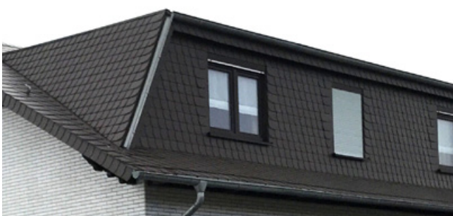
Negativ: Unpassende Dachgauben (in puncto Form, Größe)