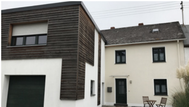
Gestalterische Disharmonie zwischen Hauptgebäude und Anbau