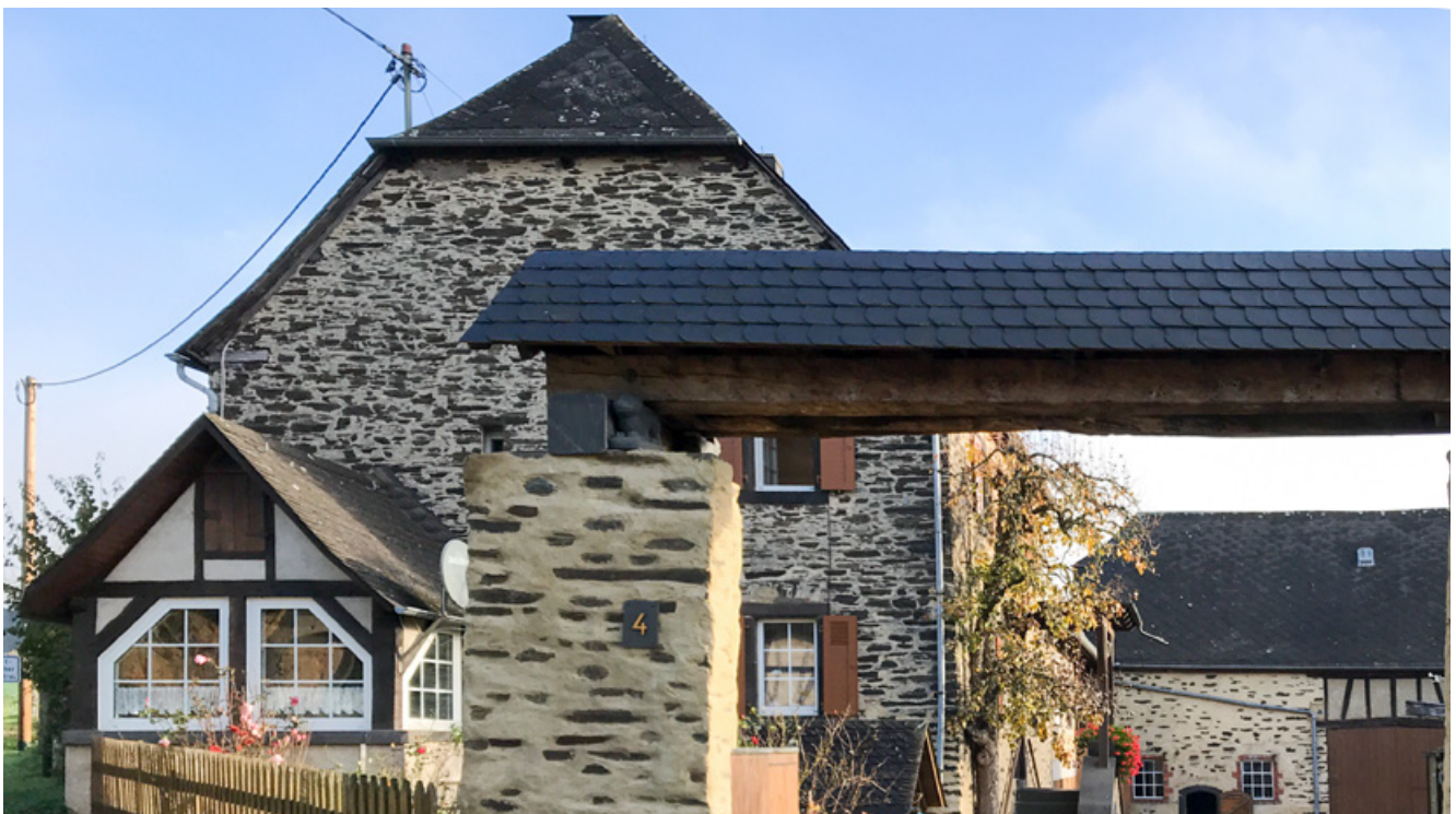
Harmonisches Zusammenspiel von Hauptgebäude und Anbau

(5) Nebengebäude und Anbauten sind in Größe und Form den Hauptgebäuden unterzuordnen. Auf eine zurückhaltende Gestaltung ist allgemein zu achten.