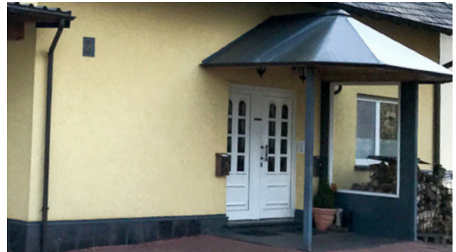
Negativ: Vordach wirkt überdimensioniert, bildet mit dem Gebäude keine Einheit