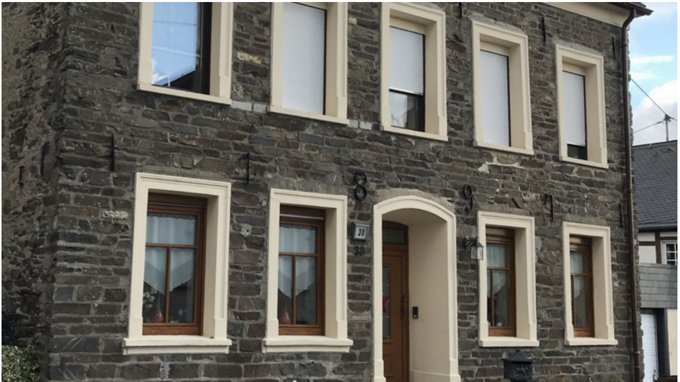
Positiv: auf Bestand abgestimmte Fensterelemente