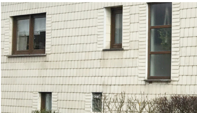
Negativ: variierende Fensterformate innerhalb einer Fassade