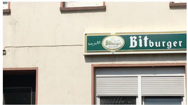
Negativ: Werbeanlagen mit offenliegenden Kabeln