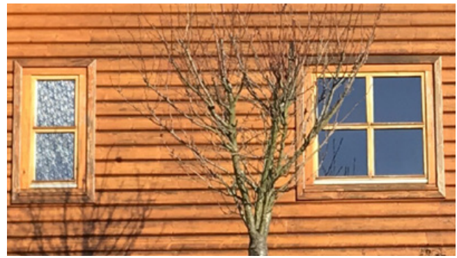
nicht bescheinigungsfähig: mit Blockhausprofil verkleidetes Wohnhaus