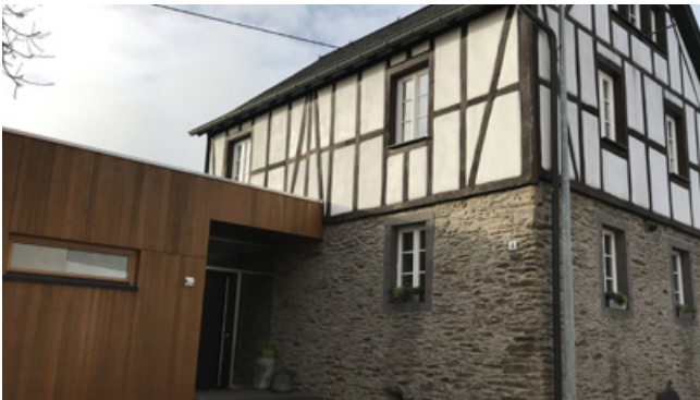
Diskrepanz zwischen Hauptgebäude und Anbau (in puncto Dachform, Material, Farbgebung)