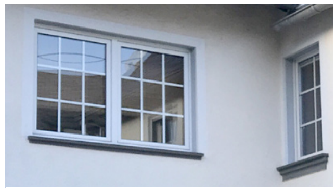
Negativ: aufgeklebte Fenstersprossen