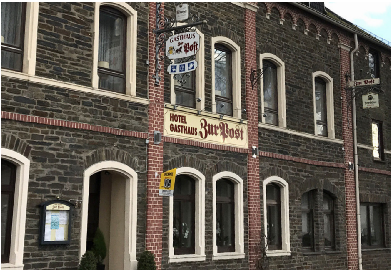
Positiv: an Gebäudebestand angepasste Ausleger

(6) Technische Anlagen, Antennen und Telekommunikationsleitungen dürfen das umliegende Ortsbild nicht stören.